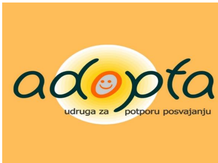
Slika 2. Projekt 'Centar posvojenja' 115