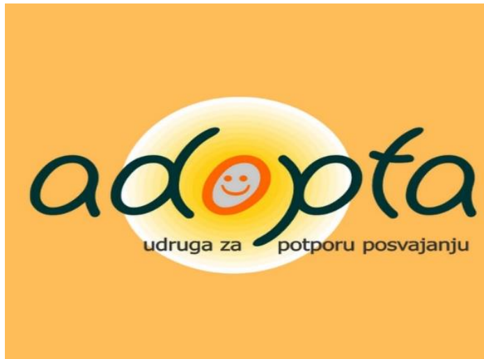
Slika 2. Projekt 'Centar posvojenja' 115