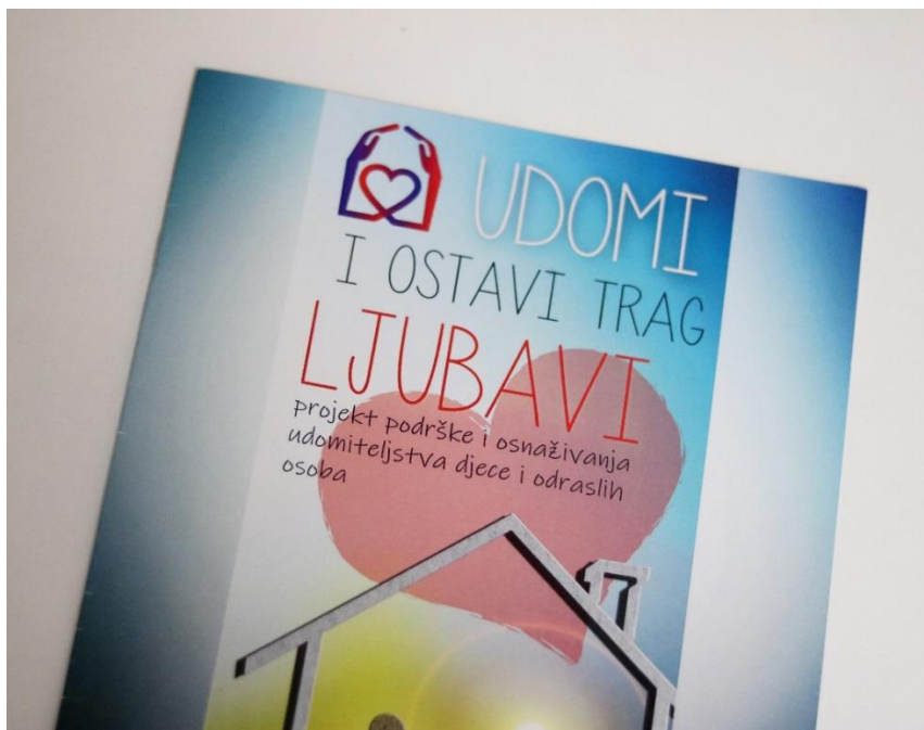
Slika 14. Praktični savjeti i smjernice projekta Udomi i ostavi trag ljubavi 127