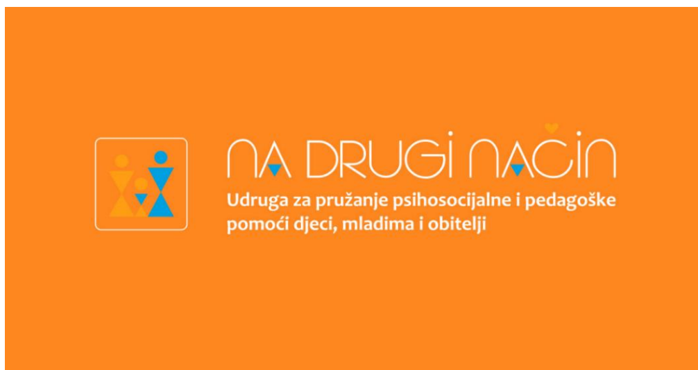
Slika 6. Održavanje programa stručne pripreme posvojitelja u organizaciji Udruge Na drugi način 119