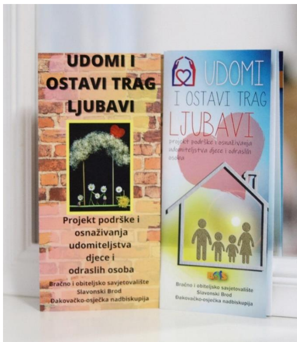
Slika 10. Promotivni materijal projekta Udomi i ostavi trag ljubavi 123