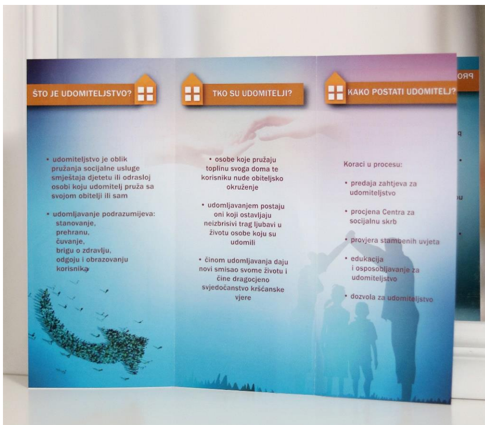
Slika 12. Promotivni materijal projekta Udomi i ostavi trag ljubavi 125