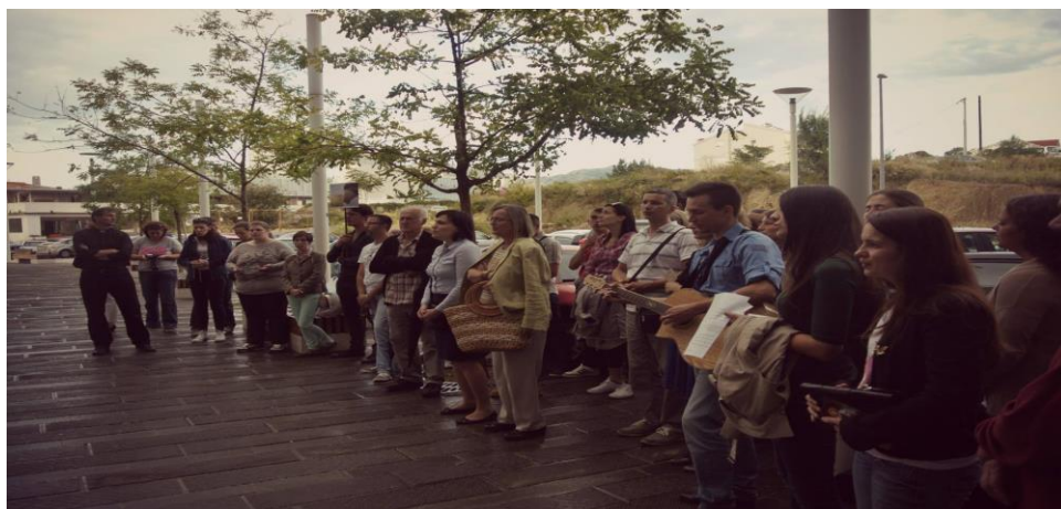
Slika molitelja ispred splitskog rodilišta za vrijeme korizmenog bdijenja