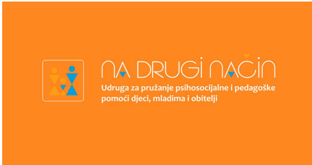
Slika 6. Održavanje programa stručne pripreme posvojitelja u organizaciji Udruge Na drugi način 119