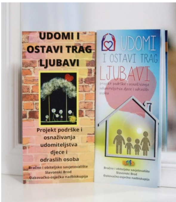
Slika 10. Promotivni materijal projekta Udomi i ostavi trag ljubavi 123